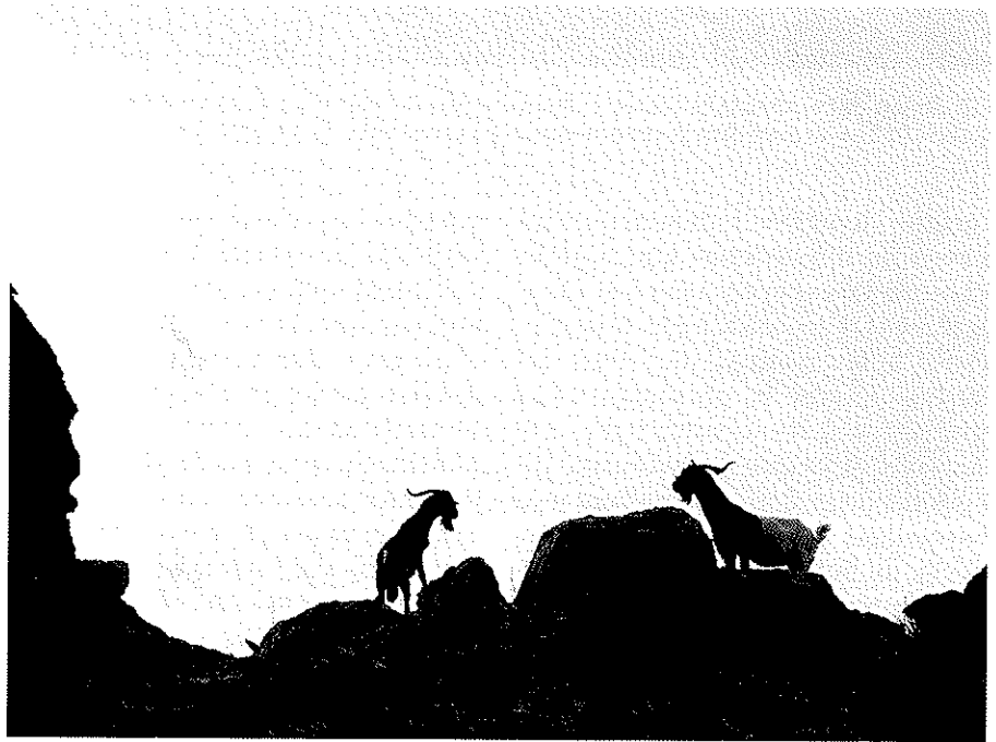
Cabres al Vedrà.

Va ser ell qui ens explicà que, pocs anys abans, les cabres havien desaparegut del Vedrà, capturades, deia, per pescadors valencians. El cert és que la flora s'havia beneficiat clarament d'aquella absència: l'illa era molt verda, amb una bona cobertura de plantes anuals i arbusts